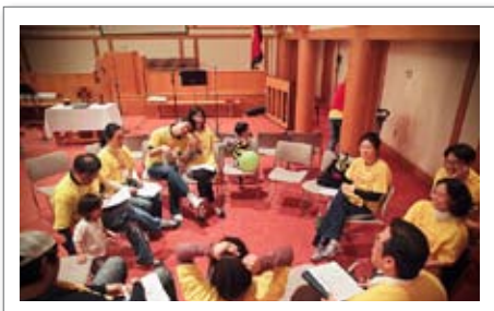
• 부부청년부 수련회