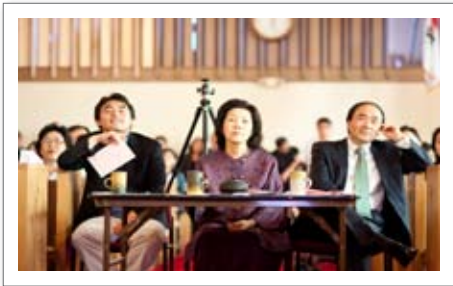
• 어머니주일 문화제