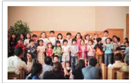
• 어머니주일 문화제