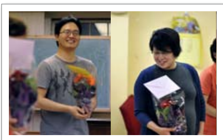
• 1부찬양대 baby shower