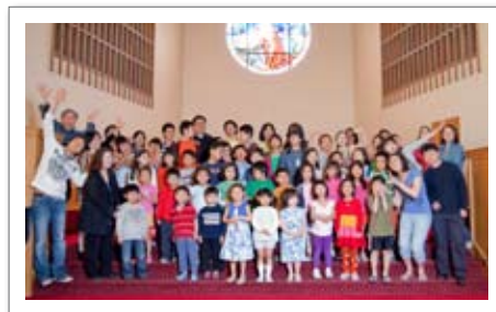
• 보스톤 한국학교