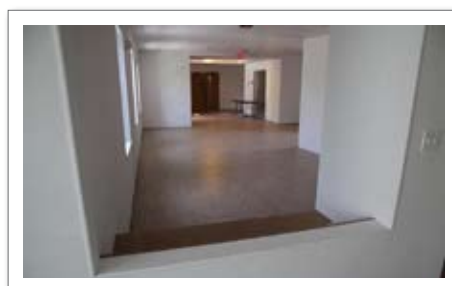
• ECC 건축과정