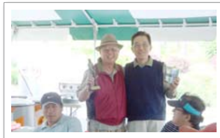
• ECC 기금 모금 골프대회